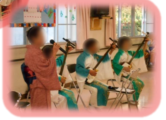
職員による干支の酉（ニワトリ）と申（サル）に扮した寸劇もあり、会が終わると利用者様から「お誕生会、とても楽しかったよ」とお声をいただき、職員もとても嬉しく思いました。